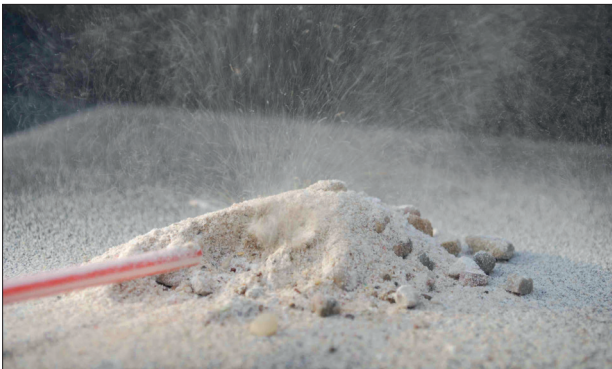
Abb 1: In ein Häufchen mit gemischtem trockenem Sediment wird vorsichtig mit dem Trinkhalm hineingepustet

Fragen Sie die SuS nach ihren Erfahrungen mit Winderosion, ob ihnen bei starkem Wind schon mal Sand ins Gesicht geflogen ist. Bereiten Sie eine „Mini-Wüste“ vor. Mischen Sie dazu trockene Sedimente verschiedener Korngrößen. Gehen Sie vorher sicher, dass keiner der SuS unter Stauballergien oder Asthma leidet. Zeigen Sie den SuS dann einen normalen Trinkhalm (die Hülle eines einfachen Kugelschreibers ist auch geeignet).