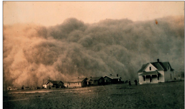
Abb 2: Eine Staubwolke aus verwehtem Oberboden umgibt eine Farm in Stratford, Texas (um 1930).

Danach sollen die SuS den Versuch auf die Realität übertragen, z.B. auf ihren Heimatort; auf ein trockenes, gepflühtes Feld; auf einen staubigen Spielplatz oder Schulhof; auf einen Strand; auf eine Wüste.